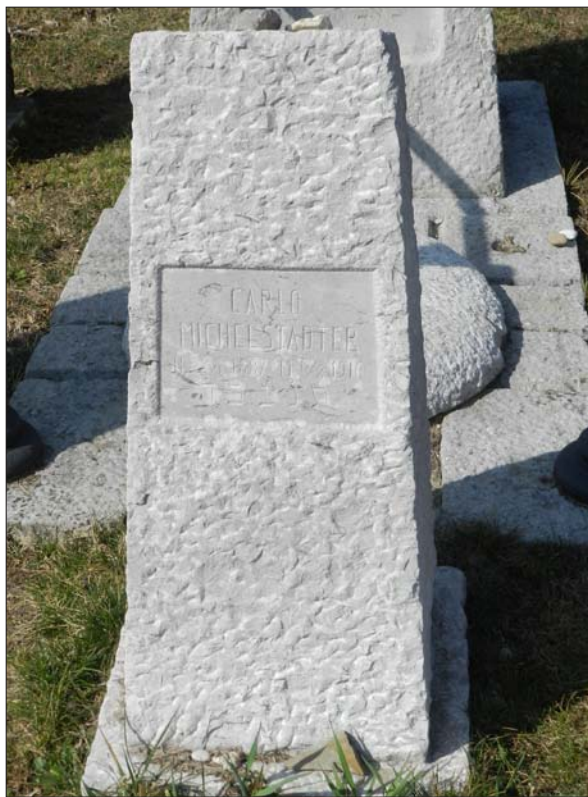
Nagrobnik filozofa Carla Michelstädterja.