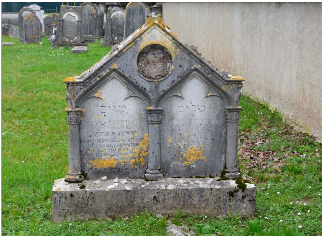
Nagrobnik članov družine Morpurgo.

dvojezične napise, hebrejske in nemške oz. hebrejske in italijanske. Vsak nagrobnik na pokopališču v Rožni Dolini je imel svojo številko, ki je bila vklesana v nagrobni kamen. Na njih pogosto najdemo različne simbole, ki označujejo posamezne judovske družine: dvignjene roke v znak blagoslavljanja, združene v palcih, duhovniška družina (Coen); vrč, iz katerega voda teče v umivalnik (Levi); golob (Jona); petelin z ječmenovim klasom v kljunu (Luzzatto); velika riba, iz ust katere moli človek (Morpurgo); grb s simbolom besnega leva (Senigaglia); knjiga ali zvitek Tore je simbol za grob učenjaka. Nekateri nagrobniki so žal izginili ob poplavih bližnjega potoka Vrtojbsica, ko pokopališče še ni bilo ograjeno z zidom. Nekatere nagrobnike pa je sčasoma prekrila zemlja, kajti talmud prepoveduje njihovo premikanje in dvigovanje. Na nekaterih nagrobnikih lahko vidimo tudi simbole, ki niso povezani z družino tam pokopanega: svetilka, granatno jabolko (simbol plodnosti), palmova veja (znak blagoslova in obnovitve), list akanta, etrog (citrona) ali venec kot znak modrosti in znanja. 21