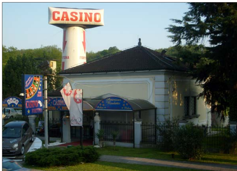
Pred desetletjem je v nekdanji judovski mrliški vežici domoval igralni salon.

šcev. Kot judovski sakralni objekt jo identificira lepo oblikovan obredni umivalnik. 49