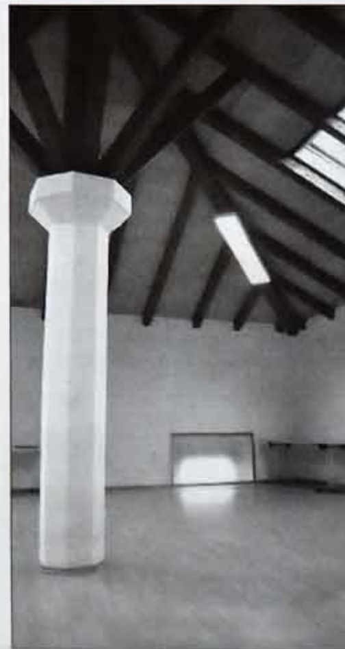
Izpraznjen lokal (levo) in zgornji del, ki ga uporablja krajevna skupnost

primorani ponovno razmišljati tržno. Definitivno pa tu ne bi več želeli imeti gostinskega lokala. Poskusili bomo najti druge možnosti,« pravi Komel. Nagibajo se k temu, da bi bodoče vsebine prostor ovrednotile iz zgodovinskega in kulturnega vidika. »Na ta prostor ne smemo gledati samo z vidika krajevne skupnosti, ampak tu